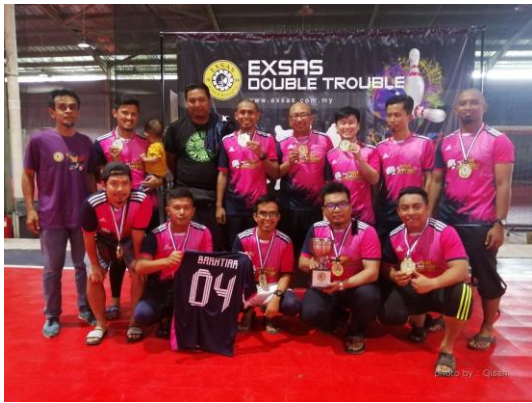
Johan Open : Battle for Bakhtiar (2004)